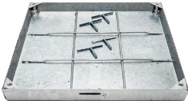
Detail Rahmen und Fülldeckel